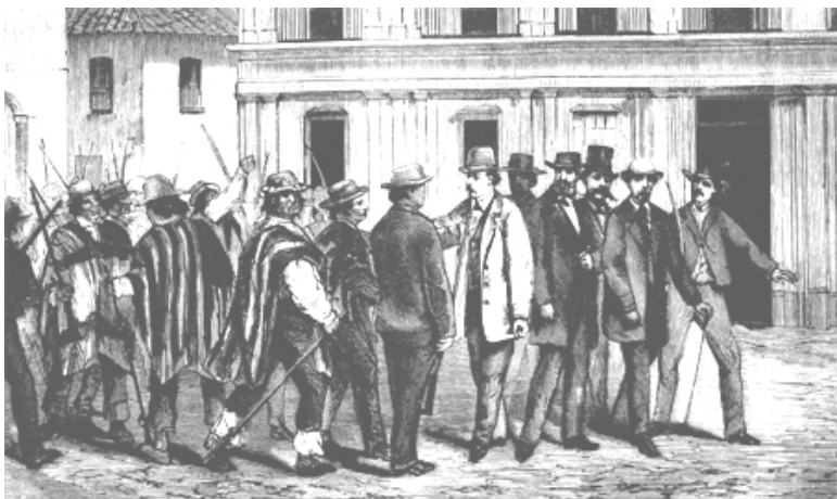
Аристократия и чоло.

тивная поддержка Бельсу и его антиолигархических, антиаристократических лозунгов со стороны ремесленников, мелких торговцев, всех городских низов.